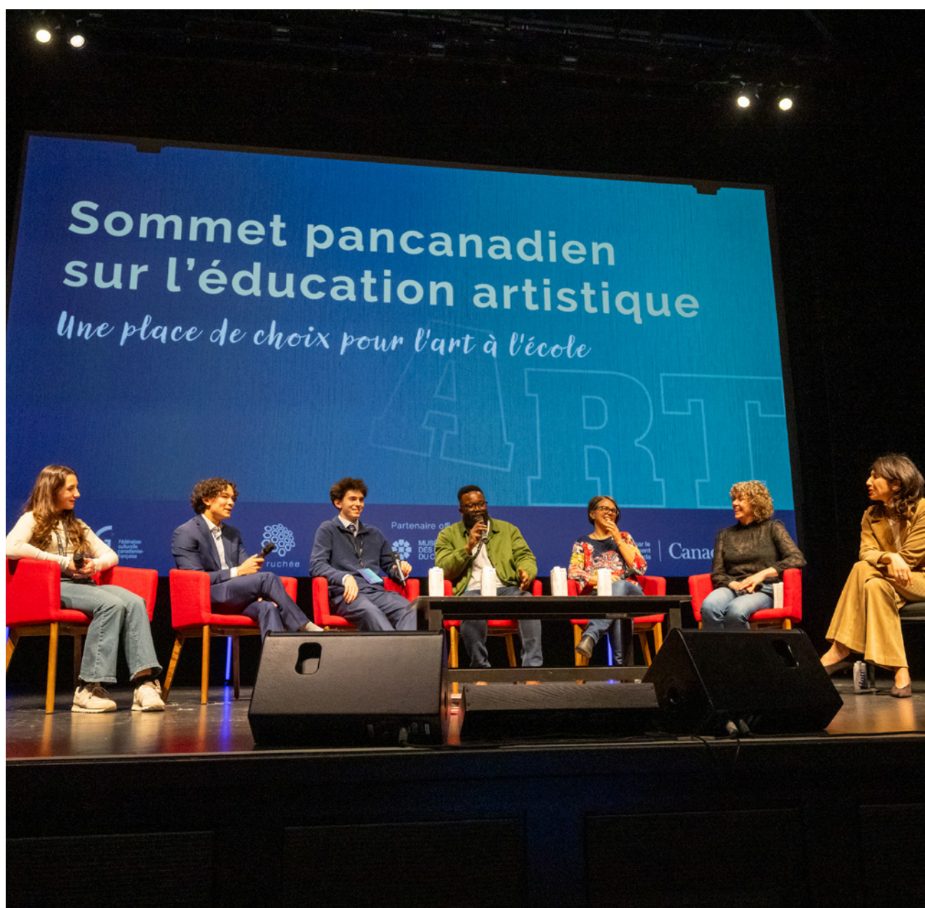
Table ronde « La francophonie plurielle comme lieu d'appartenance culturelle » avec des porte-paroles de la jeunesse franco-canadienne et acadienne.

En somme, le rôle de passeuse ou de passeur culturel, vécu de manière intentionnelle, contribue à bâtir une cohésion socioculturelle au sein de l'école et de la communauté francophone.