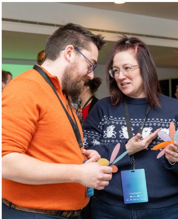
Des participant-e-s au Sommet prenant part à des moments de création et à des expériences artistiques.