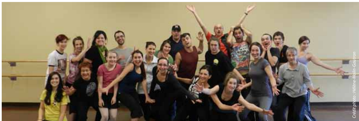
Atelier de danse donné par la troupe de danse montréalaise [ZØGMA] aux danseurs de l'Ensemble folklorique de la Rivière-Rouge dans le studio du CCFM le 10 décembre 2011.

sein de l'Alliance des réseaux de diffusion des arts de la scène (ARDAS). Il a par ailleurs été convenu que le comité se réunirait moins souvent en 2012-2013, faute de fonds, mais que la FCCF était toujours prête à appuyer en cas de besoin.