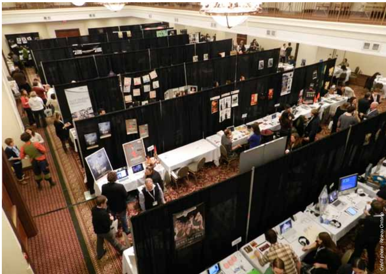
Vue de la Salle Contact, lors du Contact ontariois le samedi 14 janvier 2012

Le Conseil de direction s'est réuni à cinq reprises entre le 31 mars 2011 et le 1er avril 2012 (26-27 octobre, 16 novembre, 14 décembre — par téléphone, 15 février — par téléphone 20 et 21 mars à Halifax). Afin de maintenir un contact plus régulier, des réunions téléphoniques ont eu lieu plus régulièrement, cette pratique se poursuivra. Les nouveaux membres au CD ont participé à une session d'orientation. Cette nouvelle pratique sera