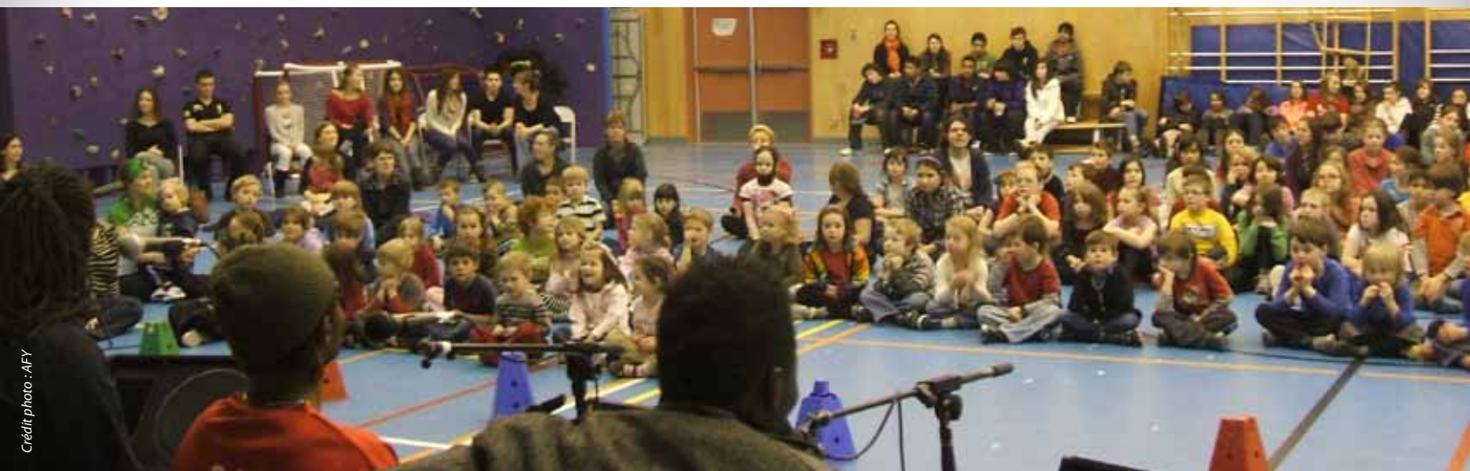
Le groupe H'Sao réchauffe les élèves de l'école Émilie-Tremblay en février 2011 à Whitehorse au Yukon.

Coalition canadienne des arts : La Coalition est un regroupement non partisan de collaboration lancé par des organismes nationaux de service aux arts. Éric Dubeau agit à titre de coprésident de la Coalition, avec Katherine Carleton - DG d'Orchestres Canada. Au cours de la dernière année, la FCCF a appuyé les efforts de communication de la Coalition et coordonné ses relations médiatiques de langue française. La FCCF a aussi joué un rôle clé dans la rédaction du mémoire pré budgétaire de la Coalition et la coordination de la Journée des arts sur la colline en octobre dernier.