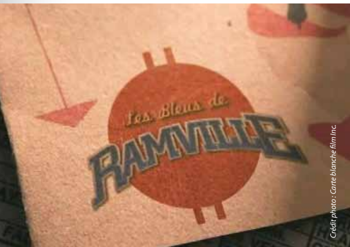
Ramville (TFO) produit par Carte Blanche Films (Ontario) reçoit une mise en nomination aux Géméaux 2012 pour le Meilleur habillage graphique.

Conférence canadienne des arts (CCA) : La Conférence est un forum national pour la communauté artistique et culturelle. Elle effectue des recherches, produit des analyses et fournit des expertises sur les politiques publiques concernant les arts, les institutions et les industries culturelles canadiennes. La FCCF maintient des échanges réguliers avec la direction générale et la présidence de la Conférence. La Fédération a favorisé la participation de représentants des arts et de la culture dans la francophonie canadienne lors de consultations régionales menées par la CCA au cours de la dernière année. La Fédération siège au comité consultatif de la Conférence et a également signé la déclaration commune sur les droits d'auteur (projet de loi C-32, devenu C-11) coordonnée par la Conférence canadienne des arts pour le milieu des arts pancanadien.