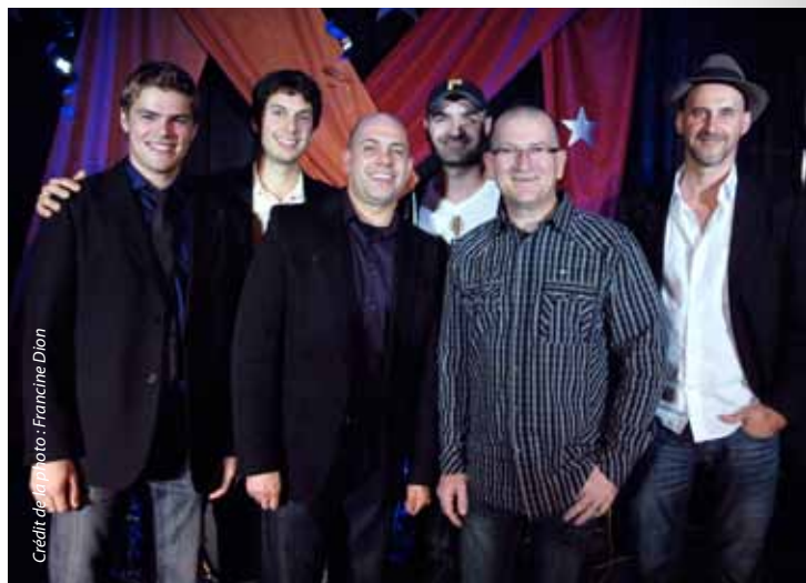
Les récipiendaires des prix Alliances remis dans le cadre du banquet du 15e anniversaire de la FrancoFête en Acadie le 6 novembre 2011 à Moncton.

Trousse du passeur culturel : Au cours de l'été, nous avons tenu une session de travail avec le ministère de l'éducation du Nouveau-Brunswick, bailleurs de fonds de la Trousse , pour convenir d'une démarche par rapport aux formations pour les intervenants en arts et culture, découlant de celle-ci. Nous avons aussi procédé à un appel d'offres pour identifier des formateurs potentiels. Malheureusement, nous n'avons pas été en mesure d'offrir la formation pour les intervenants en arts et culture sur la Trousse du passeur culturel , tel que nous l'avions prévu dû au manque de soumissions suite à notre appel. Nous avons relancé la démarche et attendons des soumissions vers la fin mai. Nous procéderons dès lors à la sélection du ou des formateurs et visons que les formations pourront être offertes dès l'automne 2012. À l'heure actuelle, plus de 200 ressources sont inscrites au répertoire de la Trousse . Il s'agit d'une augmentation de quelque 150 inscriptions depuis le début de l'année. De nouvelles inscriptions sont en attente