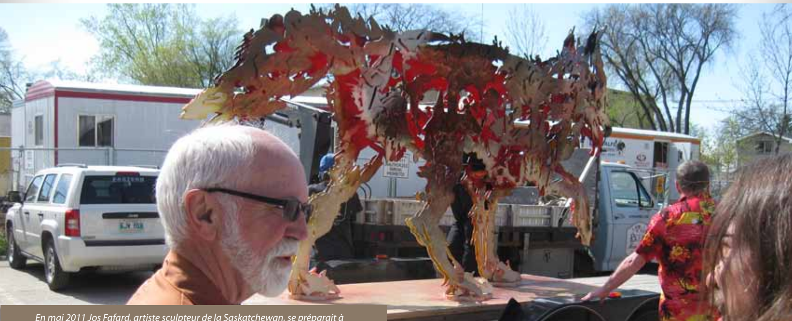
En mai 2011 Jos Fafard, artiste sculpteur de la Saskatchewan, se prépare à l'installation de son œuvre Entre chien et loup dans le Jardin des sculptures de la Maison des artistes visuels francophones à Winnipeg.

Le Comité s'est rencontré quatre fois au cours de l'année dont une en télé rencontre, ainsi que deux fois en personne lors de rencontres organisées en marge de la Francofête à Moncton et du Contact ontariois à Ottawa. Les rencontres ont été l'occasion de mesurer les avancées dans le plan d'action en diffusion, de discuter du fonds d'accompagnement pour l'accueil du théâtre ainsi que de consolider le positionnement des membres du comité au