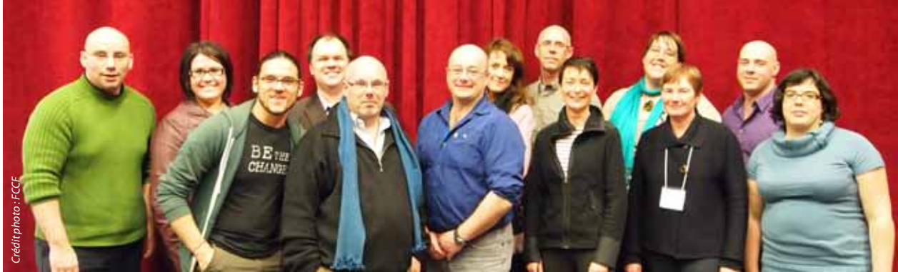
Les participants à la rencontre de la TONAC, réunion qui se déroulait dans la salle de répétition du Cercle Molière.