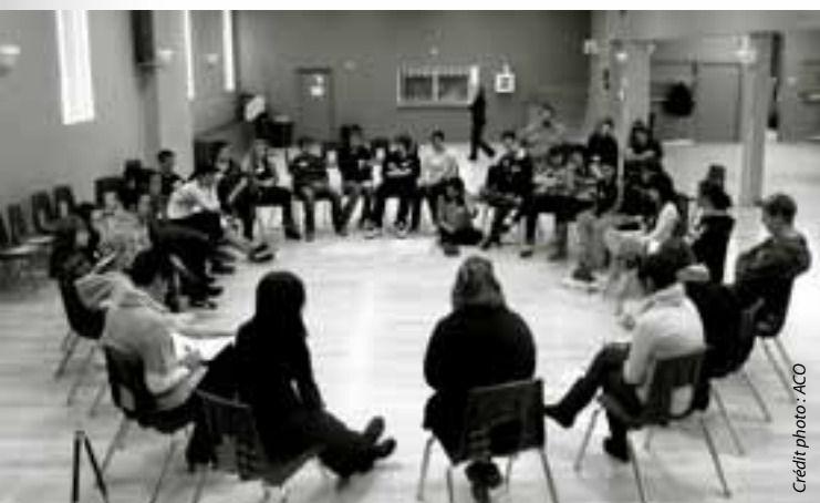
Des jeunes de Plantagenet écoutent une présentation dans le cadre du projet Carrière en Arts qui vise à leur faire découvrir les possibilités de carrières dans le milieu artistique.