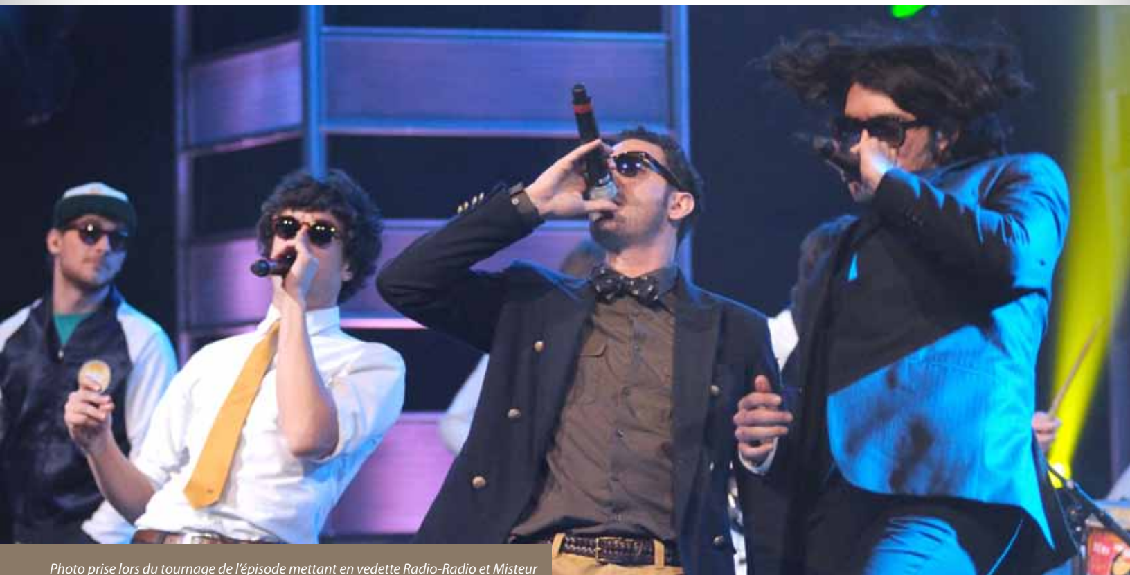
Photo prise lors du tournage de l'épisode mettant en vedette Radio-Radio et Misteur Valaire de la série Pour un soir seulement des Production Rivard à Winnipeg. Cette télésérie fut mise en nomination au Festival Rose d'Or organisé par la Télévision suisse romande.

La FCCF assure le secrétariat de cette table de concertation. La table s'est réunie à deux reprises par téléphone et a tenu un lac à l'épaule le 6 mars 2012 à Winnipeg. Les membres de la TONAC participent au Forum des leaders et cette année des rencontres ont eu lieu le 10 septembre et le 22 février ainsi que le 16 mars. Des rencontres préparatoires ont lieu avant les rencontres du Forum, afin que les membres de la TONAC puissent discuter de stratégies pour favoriser une meilleure intégration des enjeux du milieu des arts et de la culture aux démarches menées par le Forum des leaders.