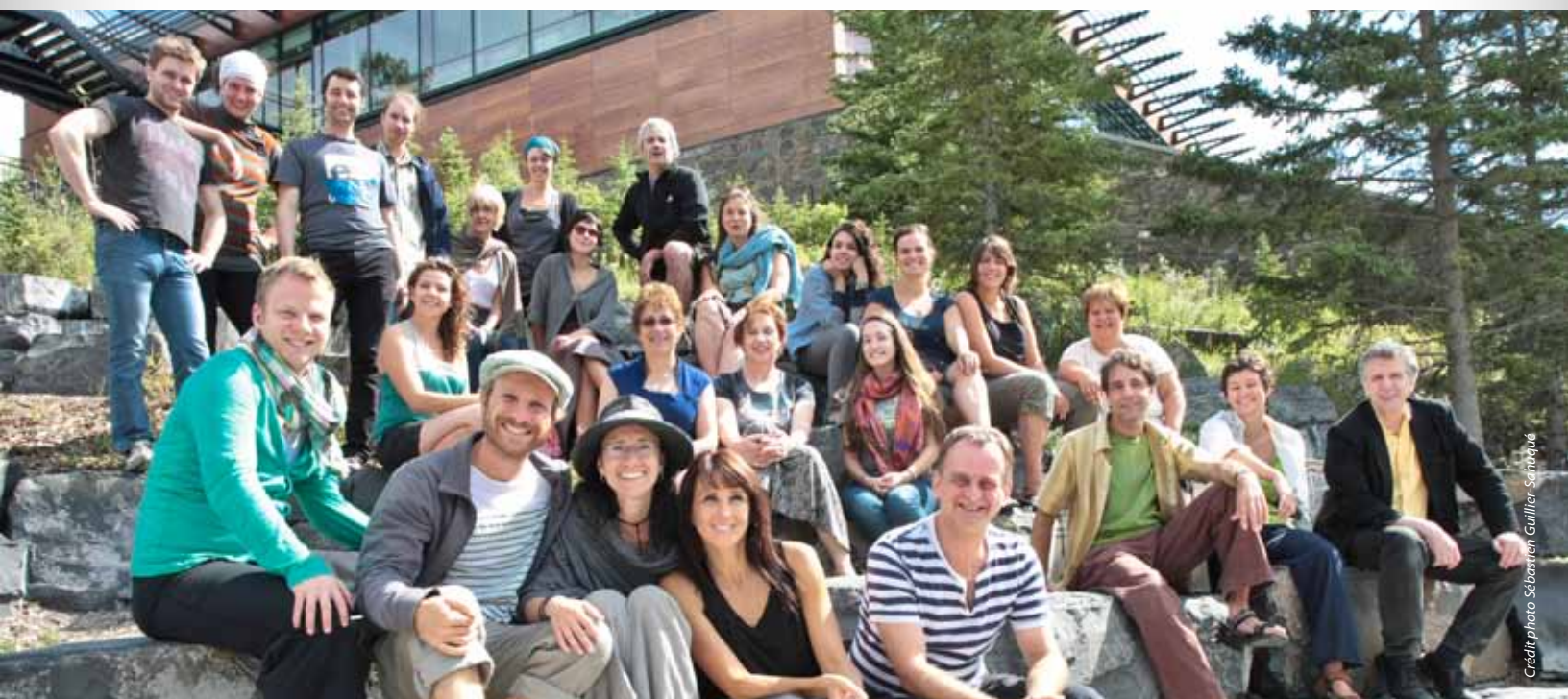
Les participants à la 3 e édition de la formation artistique Entr'ARTS 2011 organisée par le RAFA au Banff Centre. La prochaine édition aura lieu au cours de l'été 2013.

Le Conseil national s'est réuni à deux reprises, dont une fois à la suite de l'AGA 2011, puis une fois encore à Ottawa, en novembre dernier. Lors de la rencontre d'automne, les membres ont pu participer à des présentations sur les indices de proximité culturels des CLOSM et les indices de vitalité des CLOSM (Patrimoine canadien), le lien LCÉ et l'École communautaire citoyenne (FNCSF). Les membres ont également participé à deux sessions de travail sur les suivis au Forum et sur la gouvernance de la FCCF.